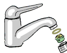
Abbildung 2: Durchfluss- und Druckminderer für Wasserhähne)

Wassersparende Duschbrausen und Wasserhahn-Aufsätze: Eine effiziente Duschbrause kann den Wasserverbrauch, und somit auch die aufzuwendende Energie für Warmwasser, um 30 bis 50% senken. Dabei wird die Durchflussmenge von durchschnittlich 13 Litern auf 7 Liter pro Minute reduziert, wobei der gefühlte Komfort gleich bleibt, da der weiche Duschstrahl mit Luft angereichert wird. Mit einer solchen Sparbrause lassen sich pro Jahr in einem 4-Personenhaushalt ca. 400 kWh Energie einsparen, was rund CHF 95.- entspricht. Der Anschaffungspreis steht mit ca. CHF 10.- bis 50.- in keinem Verhältnis zu den jährlichen Energieeinsparungen. Wasserhahn-Aufsätze (sogenannte Durchfluss- und Druckminderer für Wasserhähne), wie einer in Abbildung 2 gezeigt ist, folgen einem ähnlichen Prinzip. Das Ende des Wasserhahns wird mit einem Strahlregler versehen, welcher den Wasserstrahl ordnet und ihm unter Beimischung von Luft mehr Fülle und Weichheit verleiht. Die Einsparung des Warmwassers kann durch diese Massnahme bis zu 50 % betragen, ohne an Komfort einzubüssen.